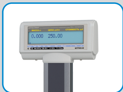
Яркий двухсторонний двухсторонний дисплей