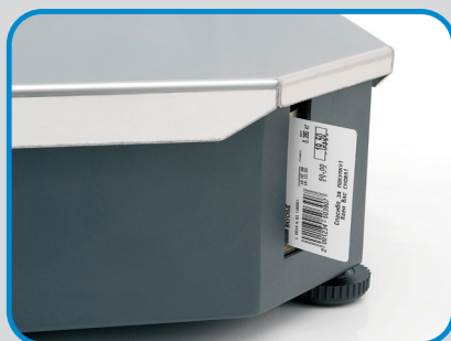
Быстрый бесшумный термопринтер